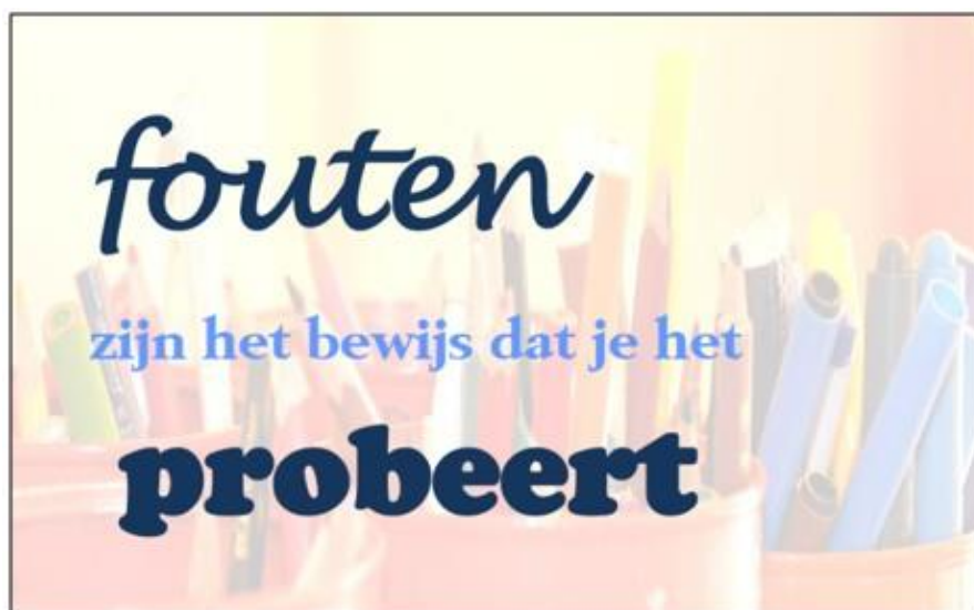
Figuur 2: Motivatieposter voor in de klas

Daarnaast is het belangrijk dat er in de klas een veilig pedagogisch klimaat aanwezig is, waarin het maken van fouten wordt gezien als een inspanning om vaardigheden eigen te maken, om te leren.